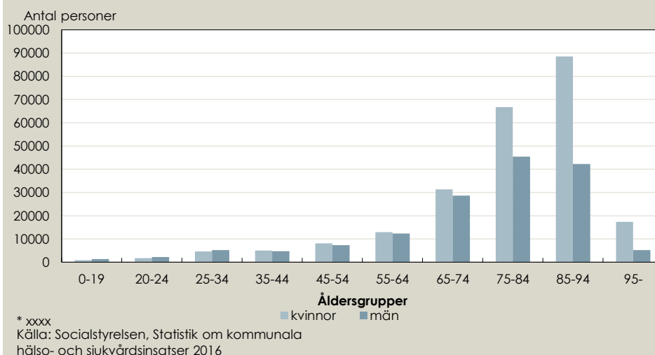
Figur 1. Antal personer som någon gång under 2016 var mottagare av kommunal hälso- och sjukvård

Ibland behöver en person kommunalt finansierad hälso- och sjukvård under en period t.ex. i samband med utskrivning från slutenvård. Men många behöver insatser regelbundet och över 40 procent av alla som fått kommunal hälso- och sjukvård har fått minst en åtgärd varje månad från samma kommun under 2016.